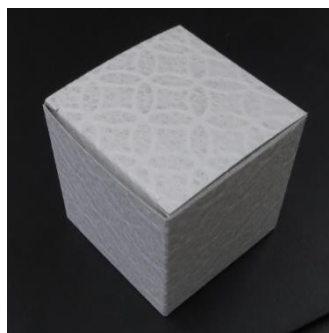
リサイクルPETフィルム/厚紙で作成した箱

* バルカナイズドファイバー：紙を原料としており、優れた生分解性を持ちながらポリカーボネート並みの強度がある材料。