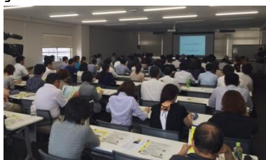
(文化生活部 文化推進課)