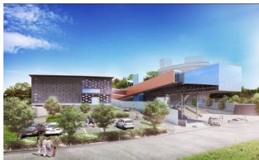
(文化生活部 文化推進課)