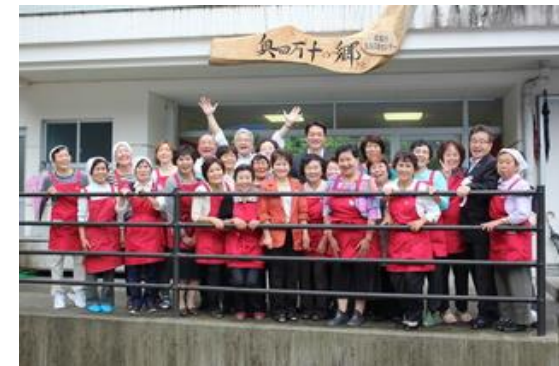
(産業振興推進部 中山間地域対策課)