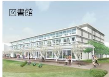
(文化生活部 私学・大学支援課)