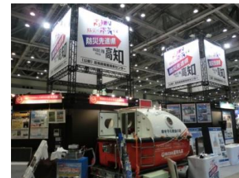
(商工労働部 工業振興課)