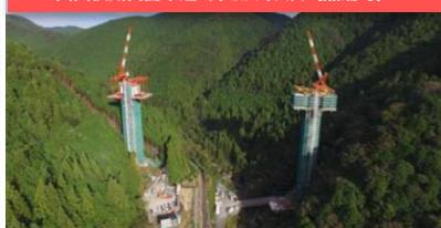
四国横断自動車道 片坂バイパス (黒潮町)