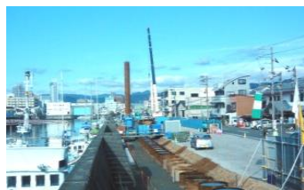
海岸堤防の耐震補強状況