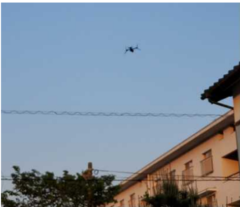
R2.4.27 18:30過ぎ 高知市朝倉甲