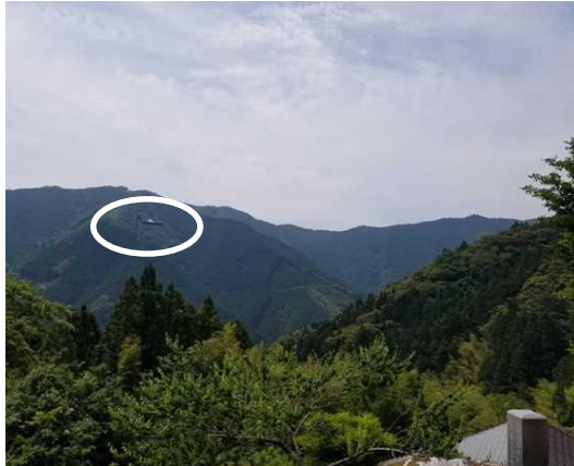
R2.6.3 10:35頃 いの町吾北地区