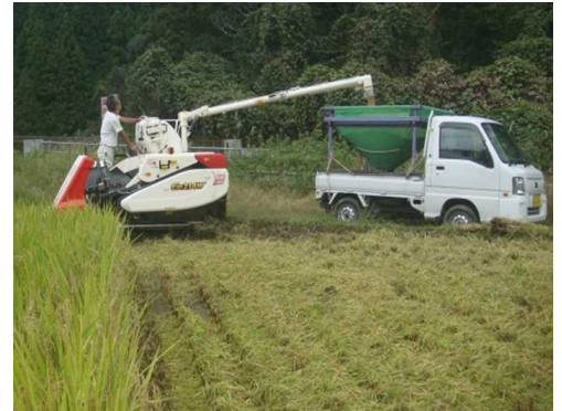
事業導入のコンバインで収穫