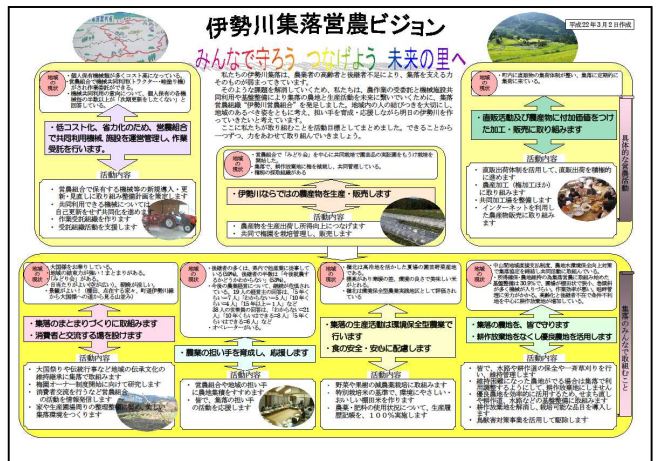
伊勢川集落営農ビジョン（平成22年3月作成）