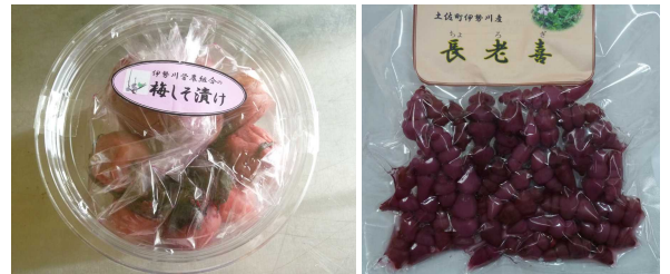
加工品（梅しそ漬け、チョコギ梅酢漬け）