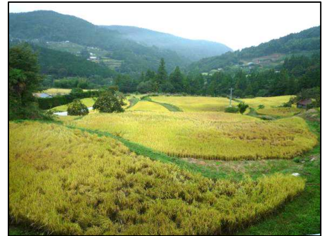
集落の斜面には棚田が広がる