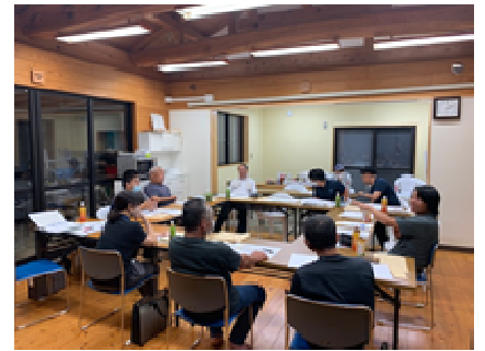
役員会による協議