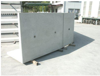
89. 耐震性 L型擁壁