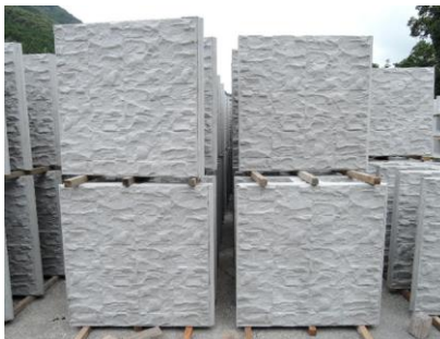
90. N-S.P.C ウォール