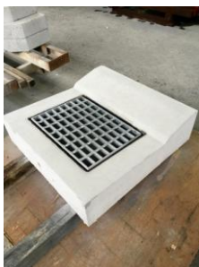
92. 歩車道境界ブロック付 L型側溝