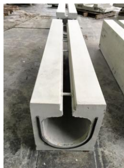
93. SK 側溝ロードレイン