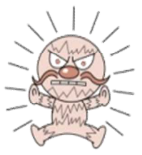
じしんまん 高知県防災キャラクター ©やなせたかし