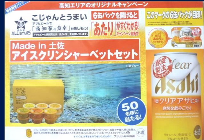
有限会社高知アイス アイスクリンシャーベットセット(H27.7.28~9.24)