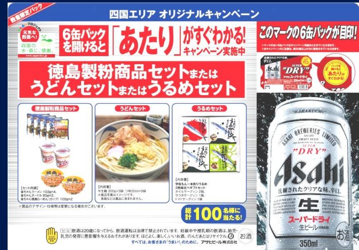
宇佐もん工房 うるめセット3色味比べギフト(H27.11.25~H28.1.18)