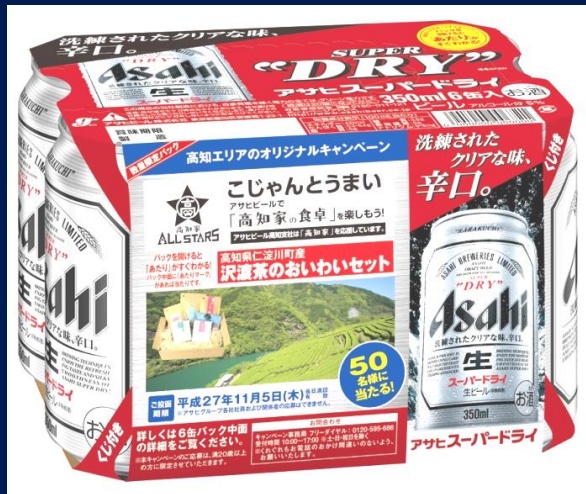
仁淀川町産のお茶 沢渡茶おいわいセット(H27.9.8~11.5)