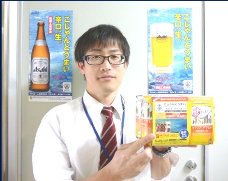
日高村産 小さな村のトマトうまいものセット (H27.4.21~6.25)