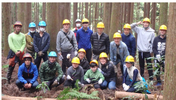
間伐体験組の勇姿

山へ移動後、間伐体験の装備を装着します。森林救援隊の方から、注意事項もありました。みなさん、けがに気をつけて、いざ体験開始です！