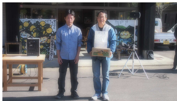
馬路村から損害保険ジャパン日本興亜株式会社様へ 記念品の贈呈