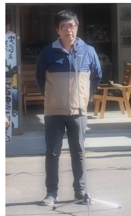
高知県 久保林業環境政策課長