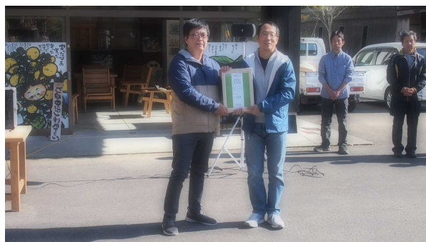
高知県から損害保険ジャパン日本興亜株式会社様へ CO2吸収証書のお渡し