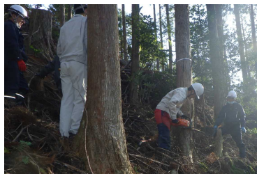
講師によるチェーンソーを使った 間伐のデモンストレーション