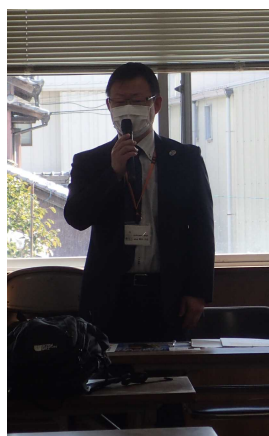
高知県林業振興・環境部 豊永副部長