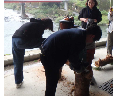
↑こちらはノコギリを使っての丸太切り体験。ノコギリの扱いにも慣れてきた頃には、男性陣VS女性陣の丸太早切り競争が行われていました。皆さんとても笑顔で活動されていました。(ちなみに早切り競争は女性陣の圧勝でした、早かった!!!)

丸太切り体験終了後は、車にて協定林がある場所へ向かい、記念写真を撮り、その後は待ちに待った昼食です。田舎寿司やイタドリなど、たくさんの料理に参加された皆さんもとても満足されていた様子でした。