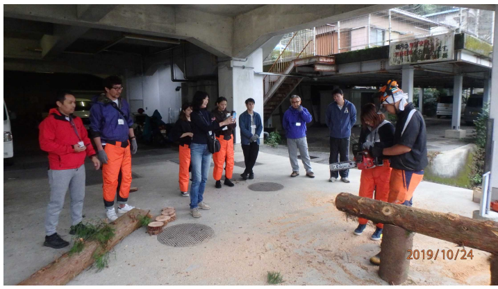
↑チェーンソーを使っての丸太切り体験。チェーンソーの扱いに苦戦している方や怖がられている方もおられましたが、森林組合職員によるしっかりとしたサポートにより、怪我なく無事作業を終えることができました。