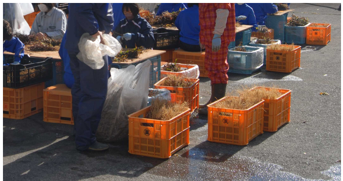
出荷作業の済んだコンテナにご注目。きれいに整えられています！