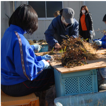
洗浄後のミシマサイコの根と茎をハサミで切る作業