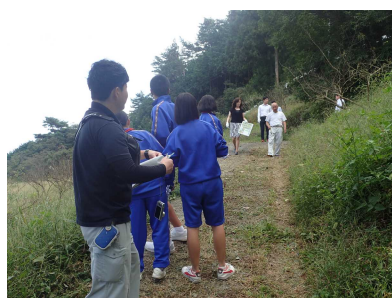
1チームに1人大人がついてアドバイスをもらいながら薬草を探します。