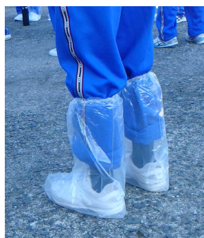
圃場に病気を持ち込まないためにフットカバーを付けるそうです。

まずは、収穫作業に必要な手袋・フットカバーが配布されました。その後、圃場へ移動し、いくつかの班に分かれ、ヒューマンライフ土佐の作業員さんから収穫作業の説明を受け、いよいよ作業スタートです。