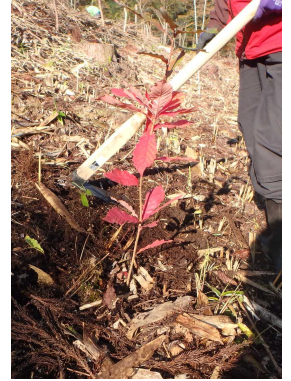
活着しやすくするため、苗木を入れる前に炭を入れます。