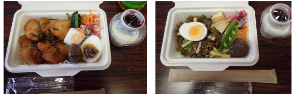
昼食は森林生態学習館でデザート付きのお弁当をいただきました。

おいしい昼食後は、しいたけの駒打ち体験です。原木にドリルで穴をあけ、しいたけの駒を打ち込みます。