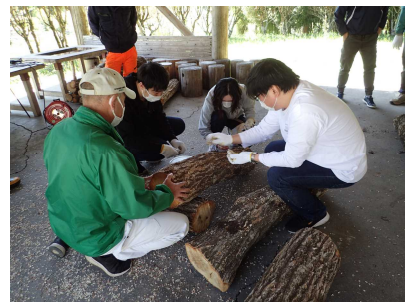
最後の1本に手分けして種駒を打ち込みます。