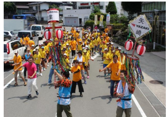
よさこい踊り（町内練り歩き）