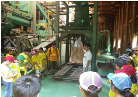
ペレット工場見学②