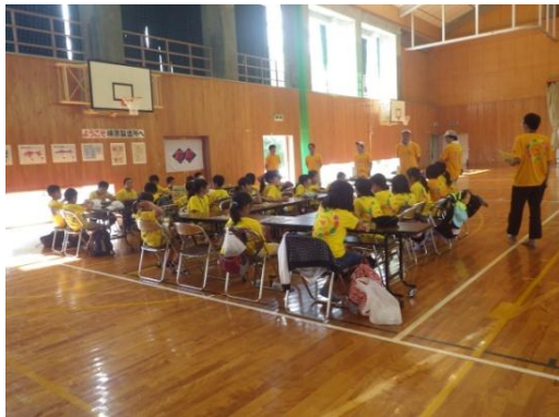
関連会社四国部品によるハーネス作成体験