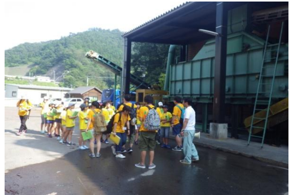
ペレット工場見学①