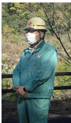
四国電力株式会社 三谷高知支店長