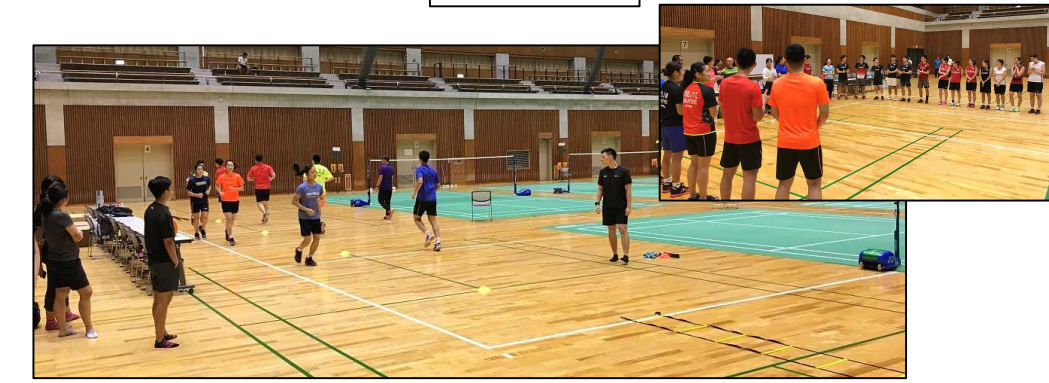
バドミントンチーム