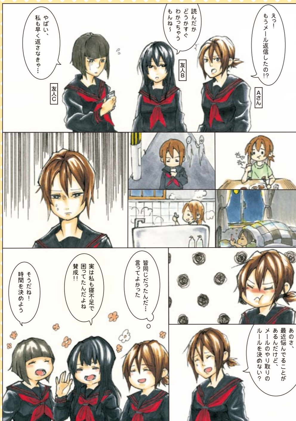
表紙・漫画制作／高知県立高知高等学校まんが研究部 川久保和由子