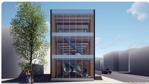
高知モデルを使用したオフィスビル (CGイメージ)