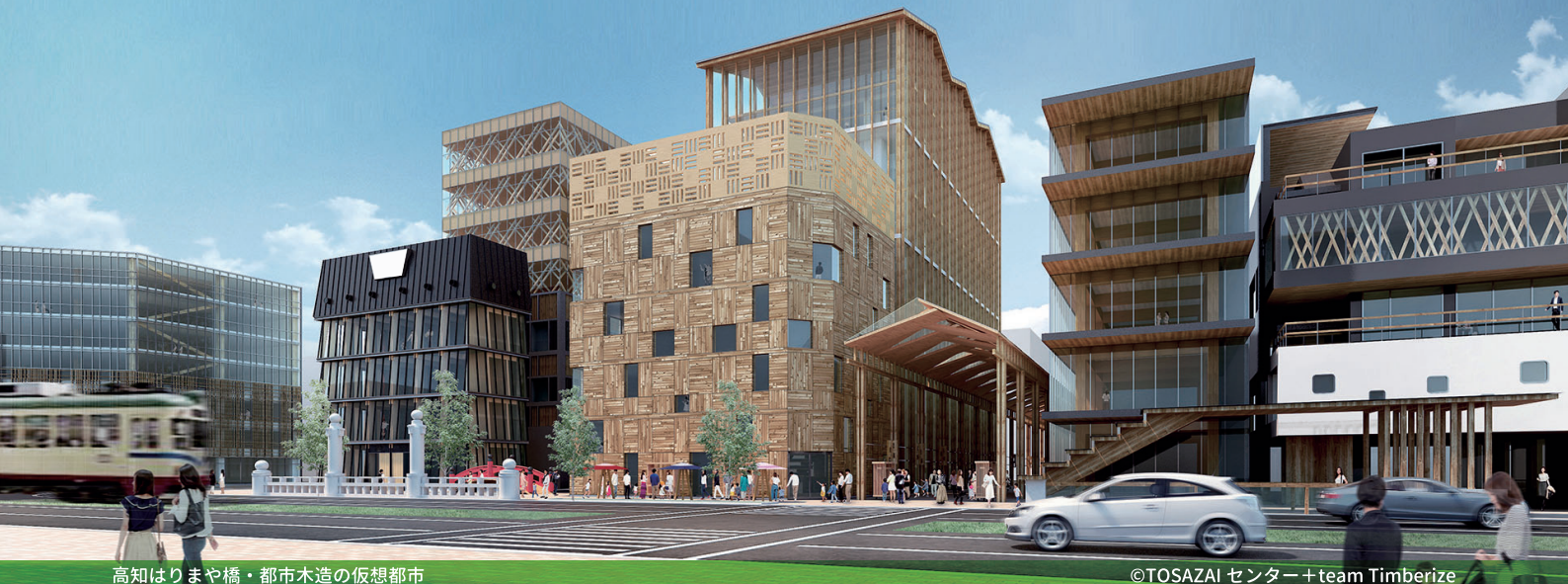
高知はりまや橋・都市木造の仮想都市