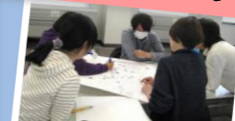
あつたかふれあいセンター 情報交換会のようす...