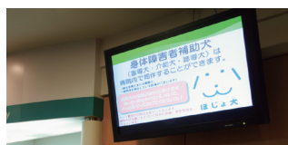
外来の待合室では、ほじょ犬の同伴について、モニターで情報発信。（市民総合医療センター）

事前にスタッフと他の患者さんにも説明し、アレルギーがある方や犬嫌いの方は申し出てもらうようにしました。他の患者さんへの配慮として一番奥のベッドを指定しましたが、それは犬が落ち着ける環境にもなったようです。