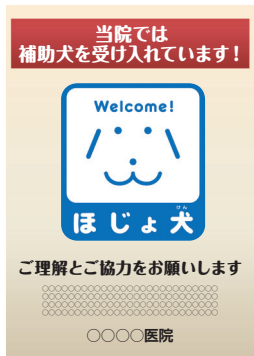
告知ポスターイメージ