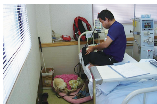
透析室では、透析が終わるまで盲導犬はベッドの横でおとなしく待機。

現在は2代目の盲導犬を同伴されていますが、1代目同様、院内のアイドル的存在になっています。