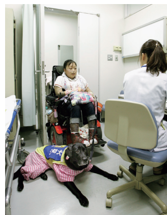
診察室では、じまにならないよう介助犬は足もとで待機。（附属病院）

気がつけたことは動線の清掃の徹底でしたが、特に汚れがひどくなることもなく、受け入れてみれば心配していたことはまったく問題になりませんでした。