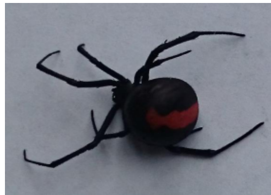
セアカゴケグモ（メス）