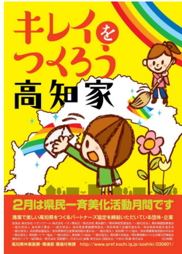
美化活動啓発ポスター（H28. 2）

各地域での取組は広がりを見せていますが、一方では、不法投棄やごみのポイ捨てが無くなる状況もあり、県民総参加の取組としていくことが必要です。