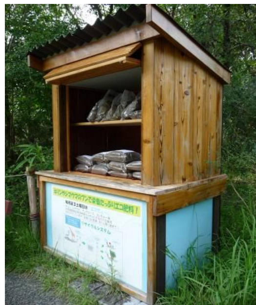
園内の来園者用堆肥配布施設