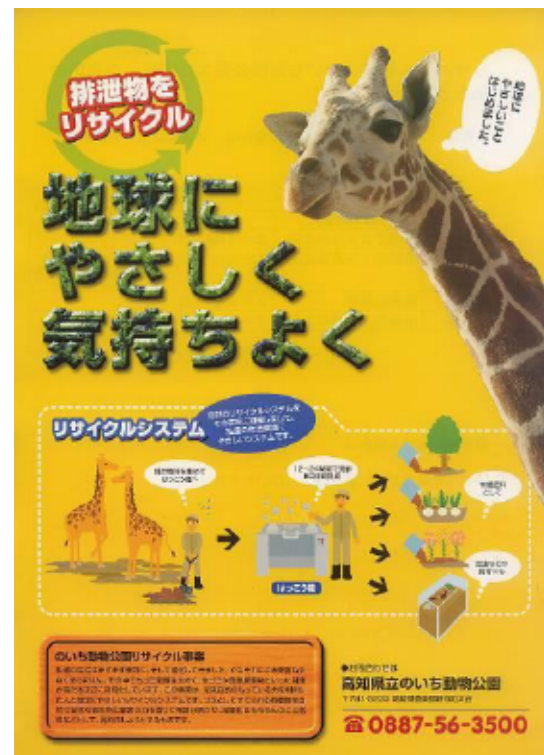
リサイクルポスター