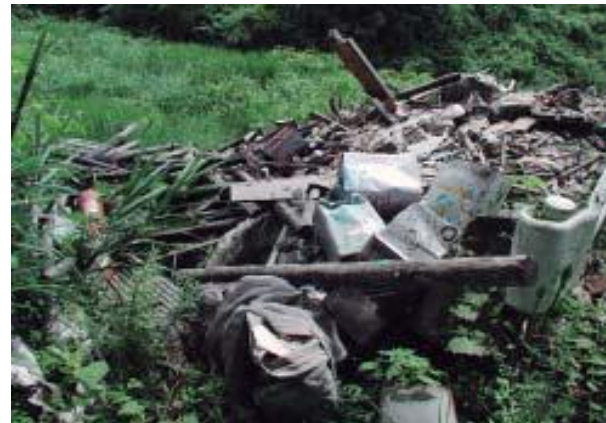
廃棄物の不法投棄現場の一例

そのため、安芸・中央東・中央西・須崎・幡多の各福祉保健所に警察OBを廃棄物監視員として配置し、日常的な監視・指導を行う一方、福祉保健所・土木事務所・市町村・警察署などで構成する産業廃棄物等の連絡協議会を設置し、一致協力して不法投棄問題に当たっています。