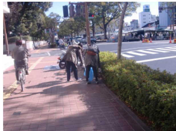
美化活動の様子（高知市）