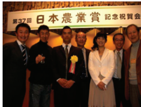
写真1: JAとさしピーマン部会が日本農業賞特別賞を受賞