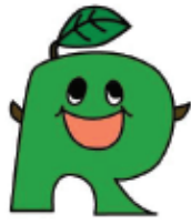
リサイクル製品等認定制度シンボルマーク

また、認定された製品や事業所等については、県のホームページ、パンフレットによる広報などを通じてその利用及び普及を推進していきます。