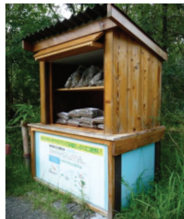
園内の来園者用堆肥配布施設