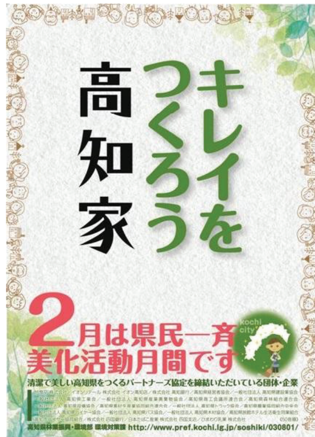
美化活動啓発ポスター(H27. 2)

各地域での取組みは広がりをみせていますが、一方では、不法投棄やごみのポイ捨てがなくなるという状況もあり、県民総参加の取組みとしていくことが必要です。