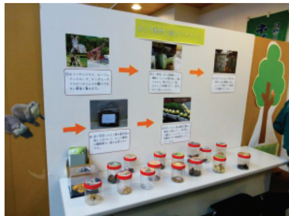
えこらぼの文化祭での展示