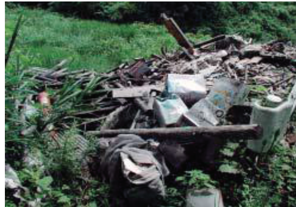
廃棄物の不法投棄現場

そのため、日常的な監視や関係機関の連携が必要であり、安芸・中央東・中央西・須崎・幡多の各福祉保健所に警察OB等を廃棄物監視員として配置し、監視・指導を行う一方、福祉保健所・土木事務所・市町村・警察署などで構成する産業廃棄物等の連絡協議会を設置し、一致協力して不法投棄問題に当たっています。