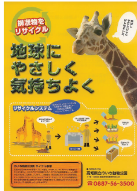
リサイクルポスター