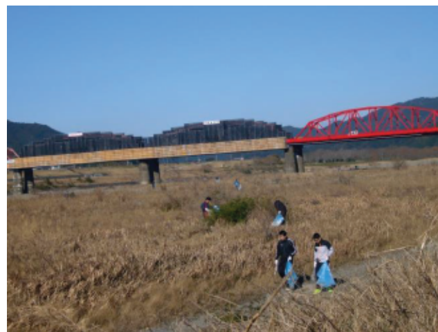
美化活動の様子(四万十市)