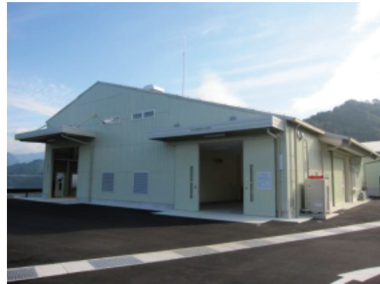
医療廃棄物処理施設「エコサイクルセンター」

※参考 平成25年度受入実績 5,786キロリットル 平成26年度受入実績 5,884キロリットル