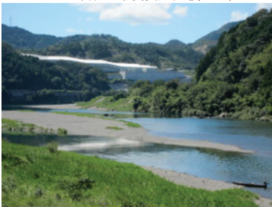
管理型最終処分場「エコサイクルセンター」

※参考 平成25年度受入実績 13,640トン 平成26年度受入実績 12,378トン