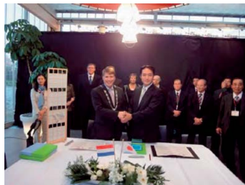
写真2: オランダ王国ウェストラント市との友好園芸協定締結式