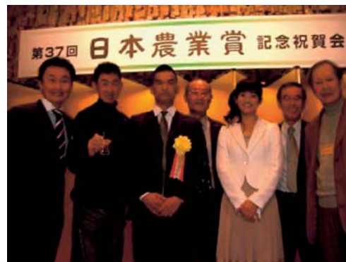
写真1: JAとさしピーマン部会が日本農業賞特別賞を受賞