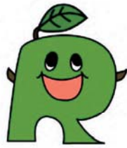
リサイクル製品等認定制度シンボルマーク

また、認定された製品や事業所等については、県のホームページ、パンフレットによる広報などを通じてその利用及び普及を推進していきます。