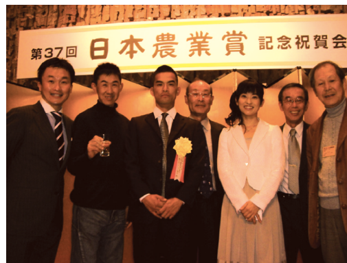
写真1：JAとさしピーマン部会が日本農業賞特別賞を受賞