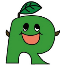
リサイクル製品等認定制度シンボルマーク

また、認定された製品や事業所等については、県のホームページ、パンフレットによる広報などを通じてその利用及び普及を推進していきます。