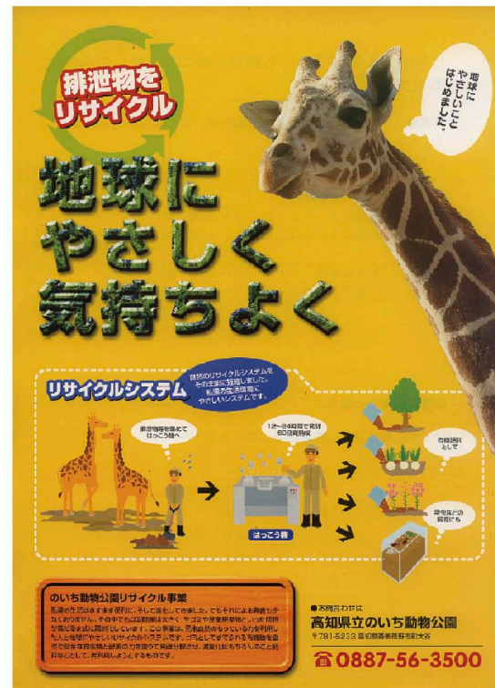
リサイクルポスター