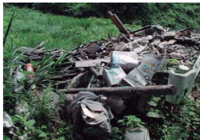
廃棄物の不法投棄現場

そのため、日常的な監視や関係機関の連携が必要であり、安芸・中央東・中央西・須崎・幡多の各福祉保健所に警察OB等を廃棄物監視員として配置し、監視・指導を行う一方、福祉保健所・土木事務所・市町村・警察署などで構成する「産業廃棄物等連絡協議会」を設置し、一致協力して不法投棄問題に当たっています。