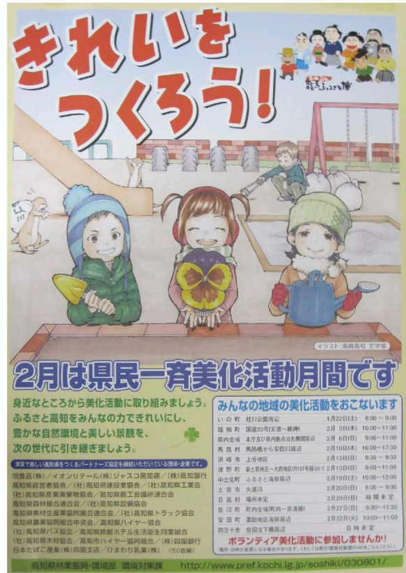
美化活動啓発ポスター(H23.2)