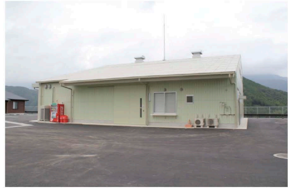
エコサイクルセンター 医療廃棄物処理施設