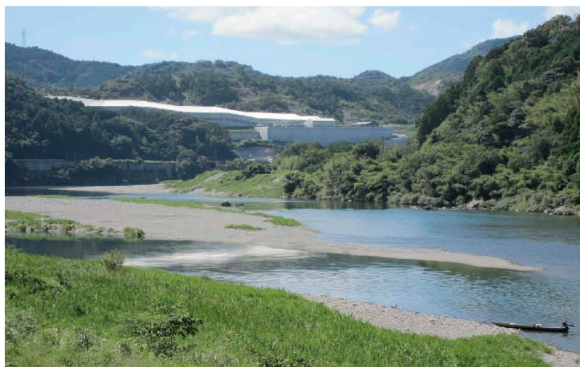
管理型最終処分場「エコサイクルセンター」