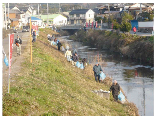
ごみの一斉清掃の様子