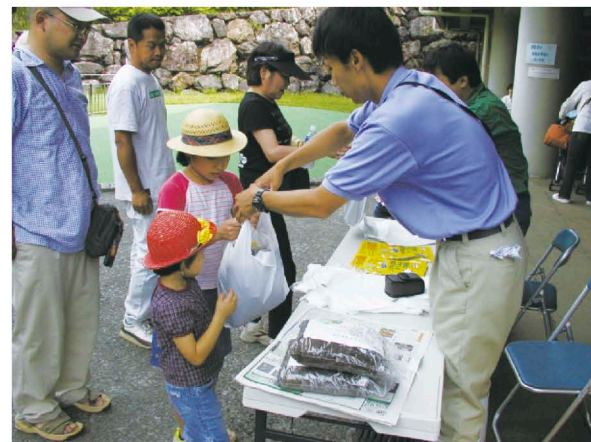
リサイクル堆肥を配布している様子