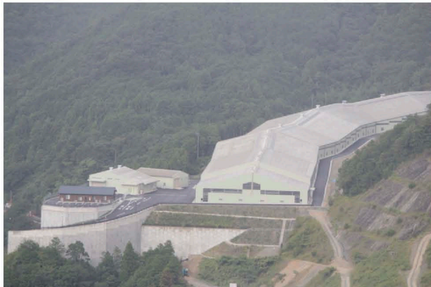
開業したエコサイクルセンター(日高村)