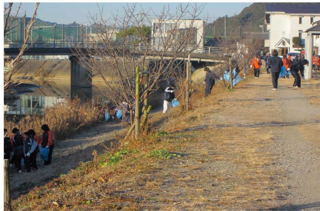
美化活動の様子(いの町枝川)