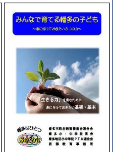
みんなで育てる幡多の子ども