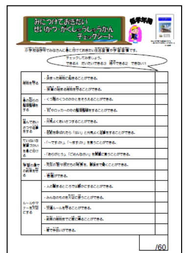
みんなで育てる幡多の子ども～生活・学習習慣チェックシート～

◎忙しいあまり、いろいろなことにルールになっていますが、親子のルールづくりのために、子どもとちょっとした時間を作ることで取り組みました。 ◎意識して時間をつくるのが大事だと思いました。