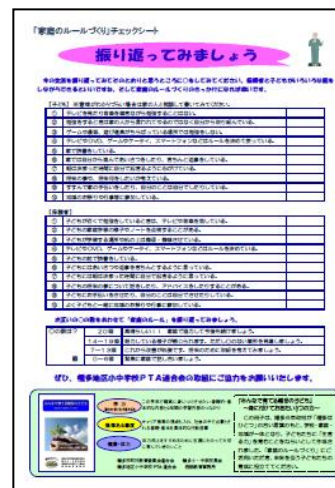
家庭のルールづくりチェックシート

2学期には、「みんなで育てる幡多の子ども～生活・学習習慣チェックシート～」によるアンケートを実施し、集計結果を全家庭に配布して、それまで取り組んできた成果と付けたい力について、もう一度各家庭で見直しをしました。