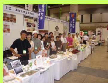
展示商談会(アグリフードEXPO)に参加