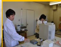
受講生に綿密に指導

課題研究 - 地域企業の抱える様々な課題や商品開発に関して、解決や開発の計画立案から実施まで、OJT(On the Job Training)で受講生に綿密に指導 課題解決の内容は、あらかじめ受講生と協議 最終的に、取り組み内容と成果をレポート形式でまとめ、講師陣に口頭発表