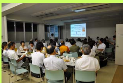
土佐FBC倶楽部例会 (日章会館1階小ホール)