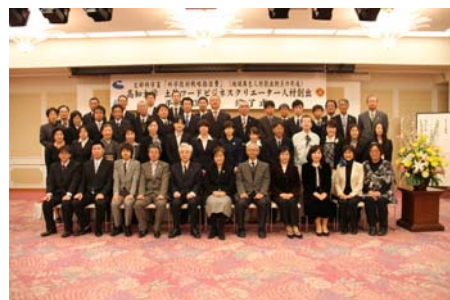
H23年度修了式 学長より修了証書授与