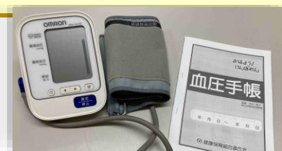
血圧計と血圧手帳