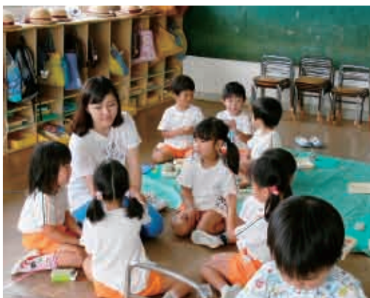
トランプ遊び。「どのカード、ひこうかな？」 (4歳児 2年生)