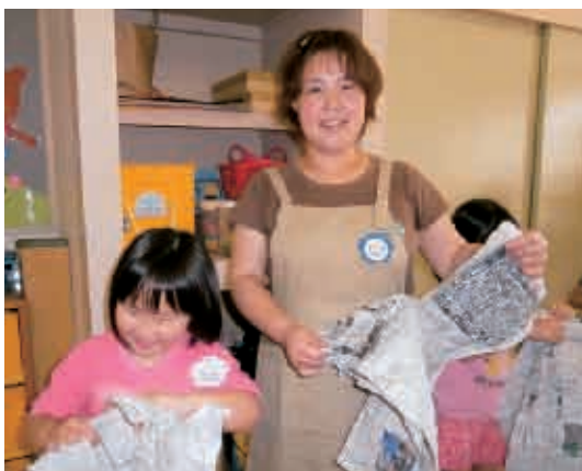
新聞紙をビリビリ。さあ、これから何を作ろうかなあ～。 (5歳児 きく組)