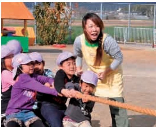
さあうん！さあうん！がんばって。 (5歳児 ぞう組)