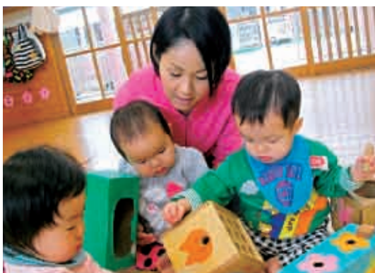
ポットン、ポットン、楽しいね。 (0歳児 ひよこ組)