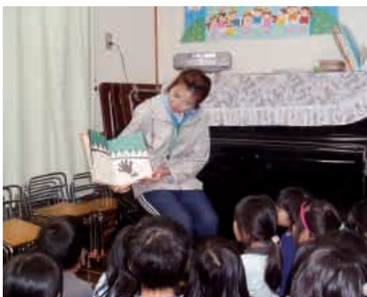
お母さんの子ども時代の大切な絵本を持参しての読み聞かせに、子どもたちも真剣。