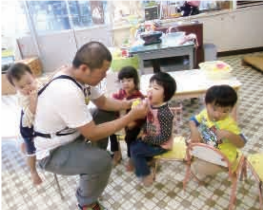
「は～い、お口あ～んしてえ。これはきれいな歯やねえ。」 (1・2歳児 もも・さくら組)