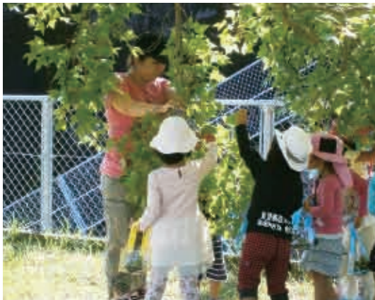
「見て見て、先生！こんな実がついていたよ！」 (3歳児 りす組)