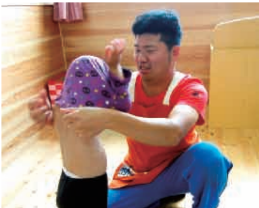
優しいお父さん先生。 (2歳児 もり組)