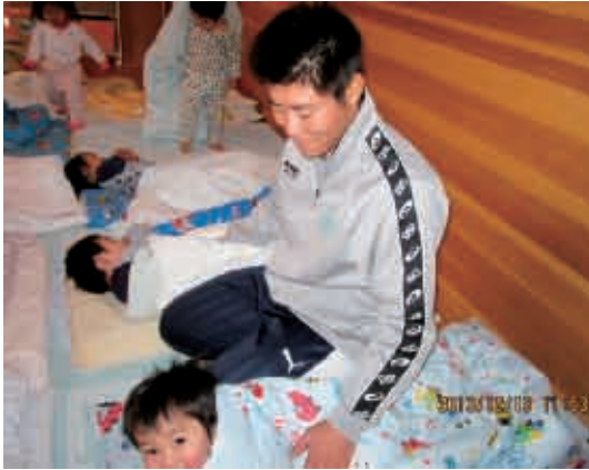
パパとお昼寝、うれしいな。 (1歳児 かわ組)