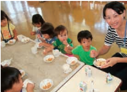
「おやつ、おいしいよ。」 (1歳児 うさぎ組)