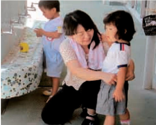
お母さんにシャツを入れてもらいました。ありがとう。 (3歳児 ちどり組)