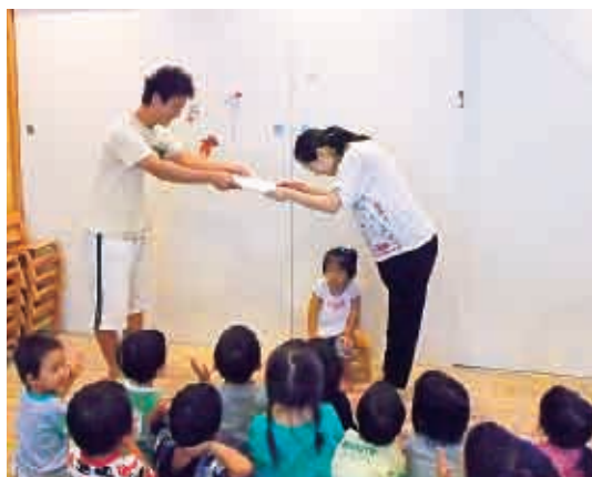
今日は一日ありがとうございました！ (2歳児 つくし組)