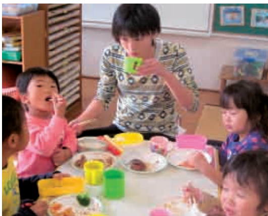
「保育園のおかずおいしいね〜。」「ぼく、おかわりするで〜。」 (4歳児 ひこうき組)