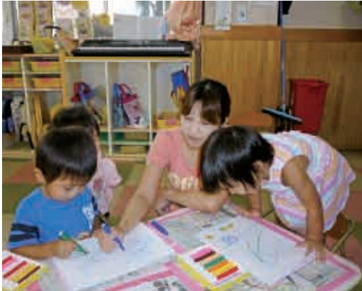
ママと一緒に絵描き。アンパンマンとバイキンマン上手に描いてくれたよ。(0・1歳児 もも組)