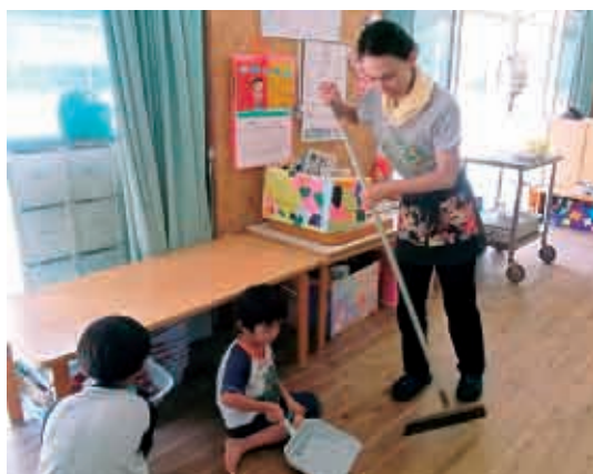
「ちりとり、ありがとう。」 (5歳児 ひまわり組)