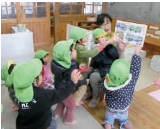
「ねえ、ねえ。これ、すご〜い。」 (2歳児 たんぼ組)