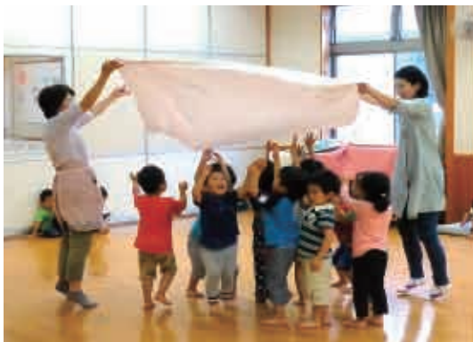
「風が吹いてきたよ〜。」みんな夢中です。 (3歳児 きりん組)