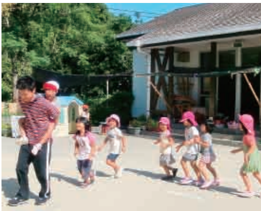
おんぶ大好き子どもたち！お父さんはさすがに体力があります。「まって！まって！」大人気でした。(4・5歳児 うさぎ・ぞう組)