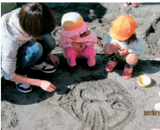
子どもたちから「かいて！」と次々に言われて、笑顔で、いろいろな絵をいっぱい描いてくれました。(3歳児 りす組)