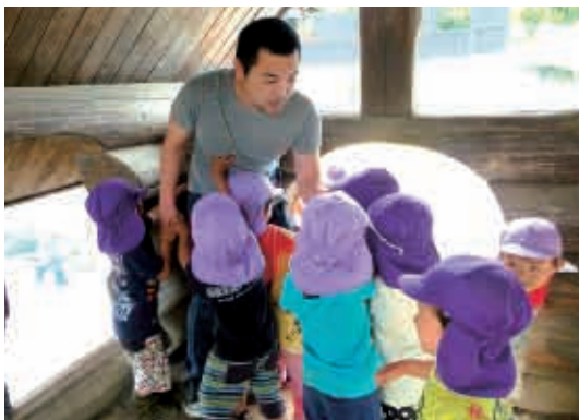
「おとうさん先生、遊ぼう！」 (3歳児 ぱんだ組)