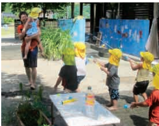
お父さんをみんなでねらっちゃえ〜！ (4歳児 黄組)