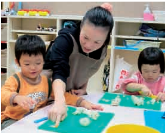
「今度はこっちもやってみる？」粘土で型はめ遊び。 (2歳児 りす組)