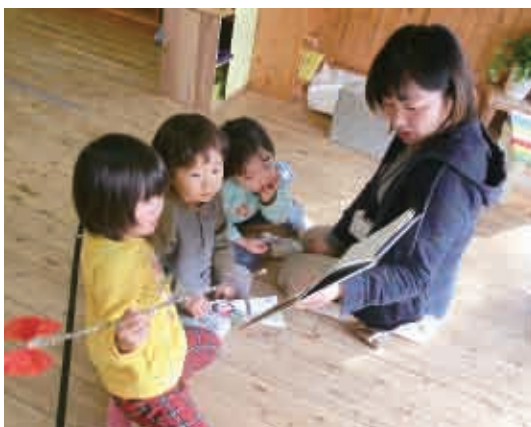
やさしい読み聞かせの声に聞き入って。 (3歳児 かめ組)