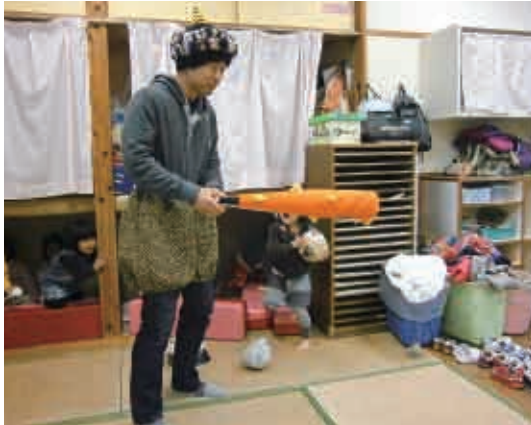
「ワオー！泣く子はいないか〜。」お父さん鬼の登場。 (2歳児 ひよこ組)