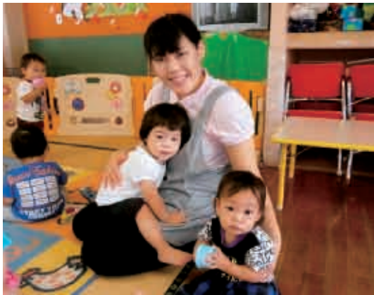
今日は、一日ずっと一緒…。うれしいね！ (0・1歳児 りす組)