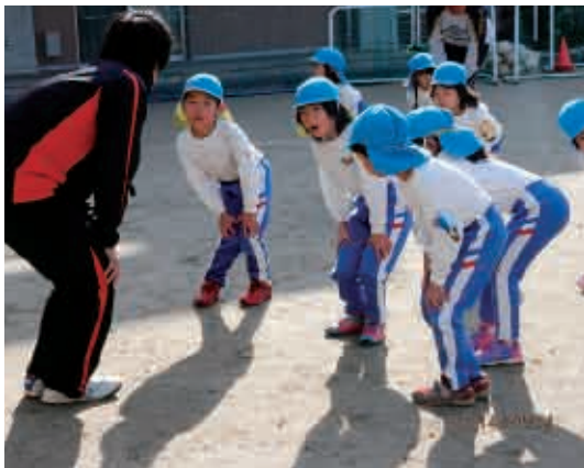
お父さんと一緒に、いちにい、いちにい。 (5歳児 ばら組)