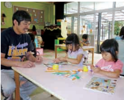
やさしいパパに見てもらって、七夕飾りの輪っかを作るからね。(4・5歳児 ひまわり組)