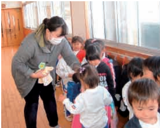
忘れ物ないかな？タオルも入れたかな？ (3歳児 りす組)