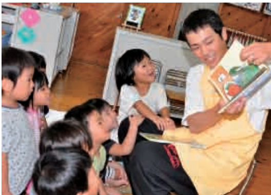
“わにわに”の絵本、おもしろいね。つぎは何が出るかな？ (3歳児 うさぎ組)