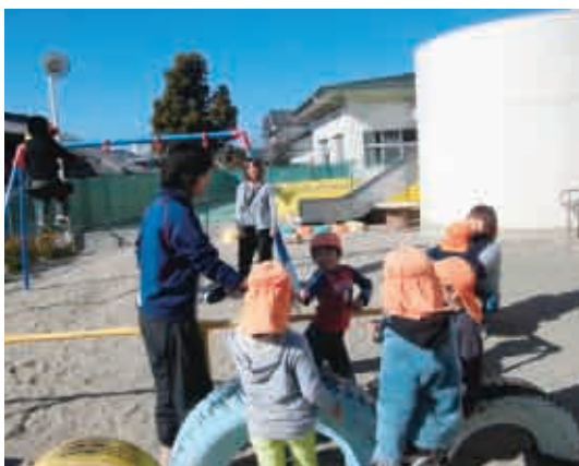
追いかけて鬼にはまってしまったお母さん。楽しそう！ (4歳児 きりん組)