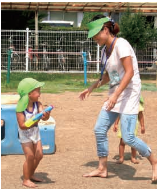
「まてまて。」「せんせいに、えい！」 (2歳児 りす組)