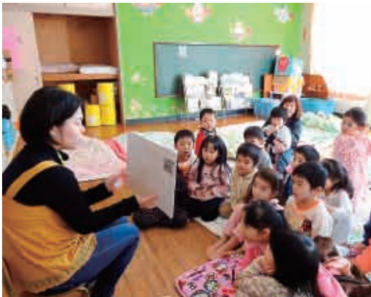
紙芝居を読みます。ドキドキ、ドッキン！ (4歳児 ぞう組)