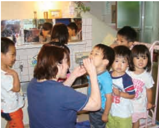
順番まち。早く磨いてほしいな。 (3・4・5歳児 たんぼぼ・さくら・すみれ組)