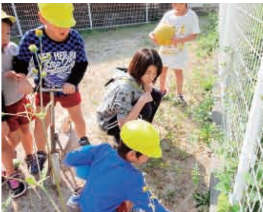
わたしのお母さん、虫さがしが上手だよ！ (5歳児 くま組)