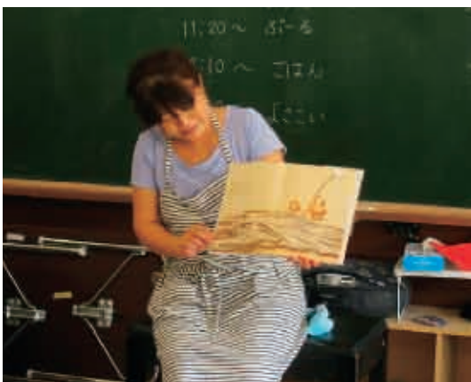
降園時、お母さんに絵本を読んでもらいました。 (5歳児 はと組)