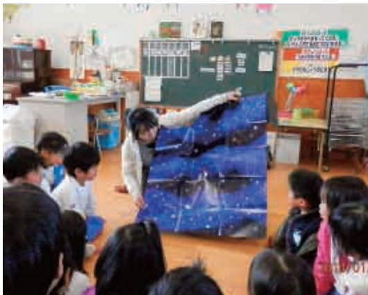
宇宙って数え切れないほど、星があるんだよ。 (5歳児 ひまわり組)