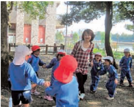
園外保育に一緒に行ってもらって、かごめかごめをしました。 (4歳児 かもめ組)