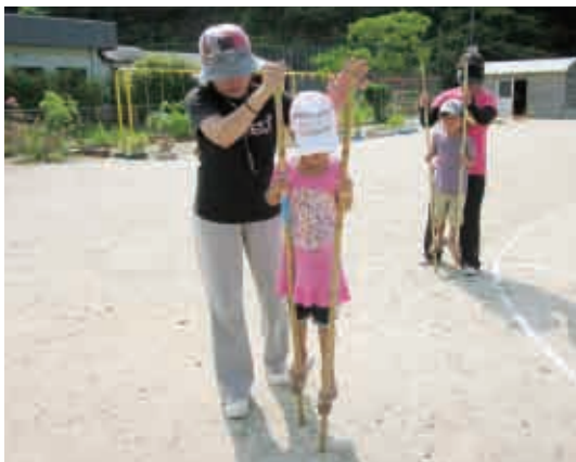
「上手く歩けるように、支えているから大丈夫だよ。」 (4歳児 うさぎ組)