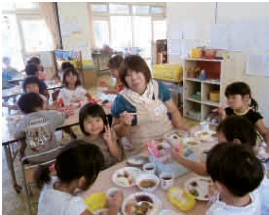
「おいしいね！残さず食べようね。」 (3・4・5歳児 ばら・きく・すみれ組)