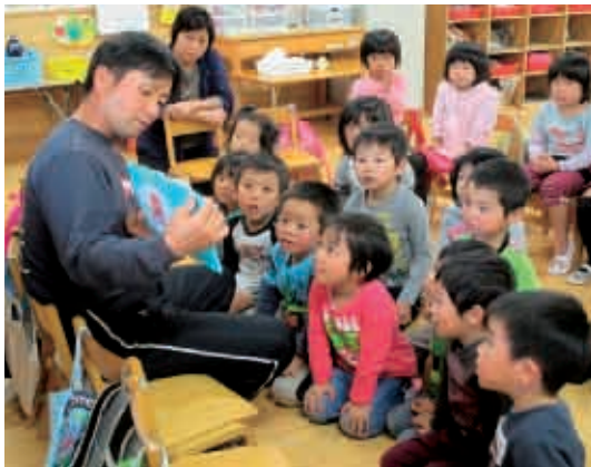
お父さんが読んでくれる絵本にみんな真剣！ (4歳児 黄組)