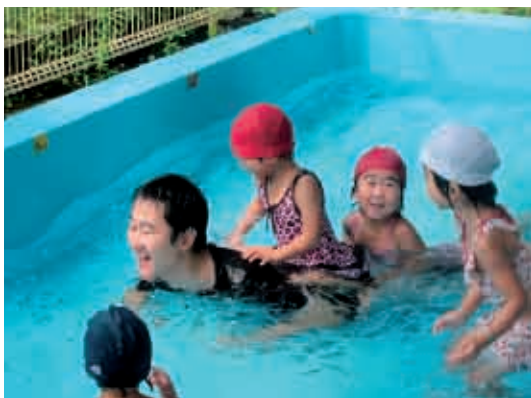
お父さんワニは力持ち。ジャンプジャンプ気持ちいい！ (3歳児 りす組)