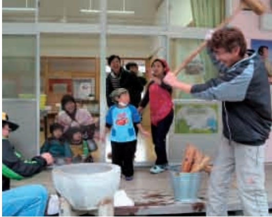
「パパ、がんばれ！」力強いお父さんの餅つき。 (5歳児 ぞう組)