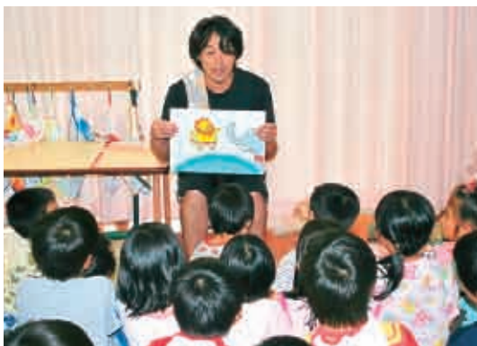
お父さんの読む紙芝居に、真剣なまなざしの子どもたち。 (5歳児 ひまわり組)