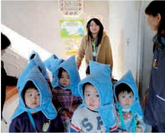
避難場所まで頑張ろう。 (3歳児 うさぎ組)