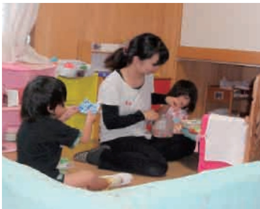
ままごと遊び楽しいな。昔懐かしいでしょう？ (3歳児 うさぎ組)