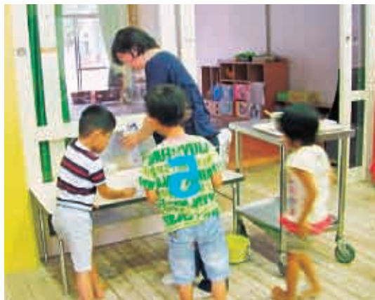
ちょっとまってね。いま牛乳を入れてます。 (4歳児 すみれ組)