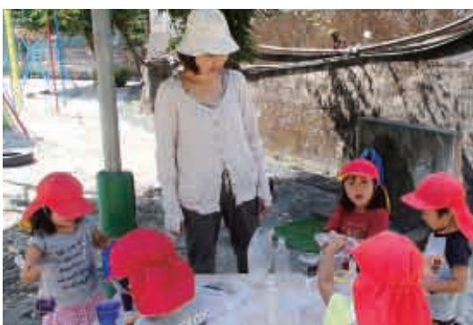
色水つくってジュース屋さん。お母さんは何色のジュースがいい？(3歳児 ばら組)