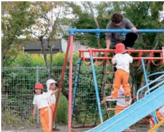
「ぼくたちも上がっていくよ！待っててね！」 (4歳児 2年生)