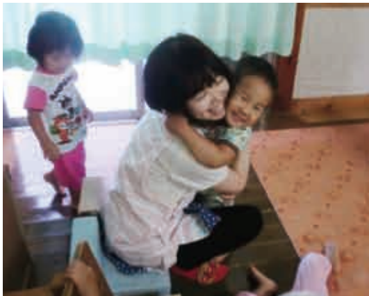
クラス全員を抱っこ。素直に身体を寄せてくるのに驚きを感じていました。(2歳児 ペんぎん組)