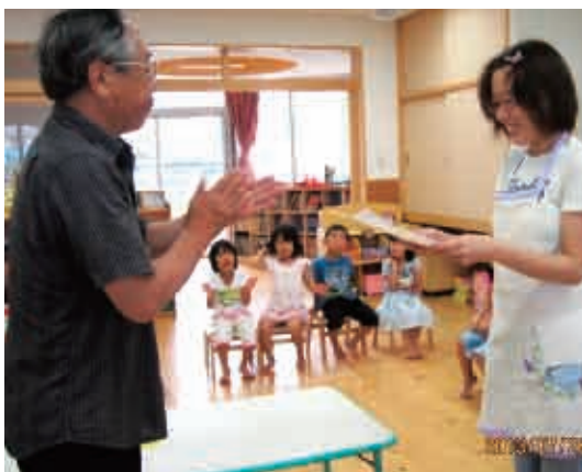
お疲れ様でした。また一緒に遊んでね。 (5歳児 そら組)