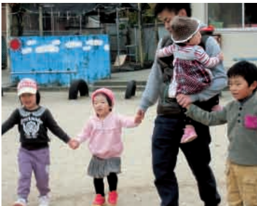
体操のお兄さんに 変身！ (全クラス)