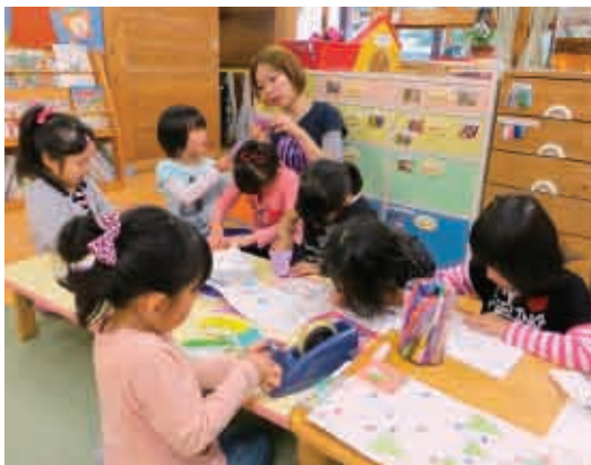
一緒に折り紙。「ここは山折りだね、こう折って〜。」 (5歳児 青組)