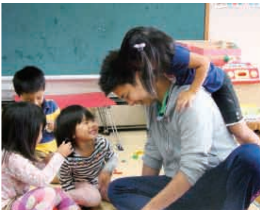
お父さん先生の背中は、大きいな～。ジャ～ンブ! (3・4・5歳児 たんぼぼ・さくら・すみれ組)