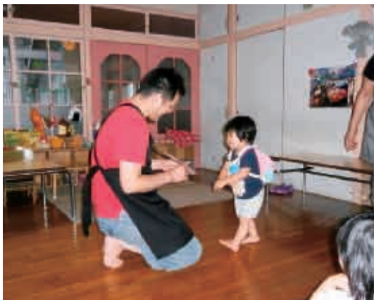
子どもから修了証をもらって、うれしそうなお父さん。お疲れ様！ (2歳児 くま組)