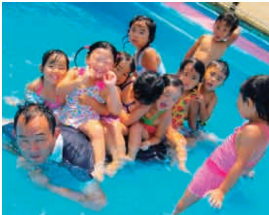
お父さんワニの背中、楽しいな。 (3歳児 たんぼぼ組)