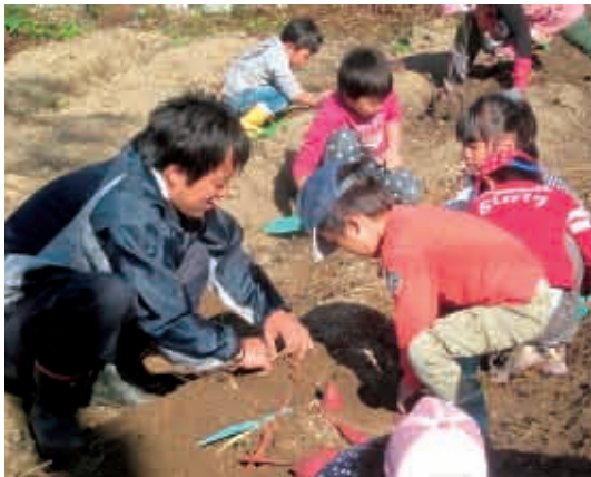
「ほら、ここにもお芋があった！」お父さん、雨靴もはいて大活躍。 (5歳児 くじら組)