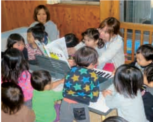
「何を歌おうかな。」お母さんのピアノにうっとり…。 (1歳児 うさぎ組)