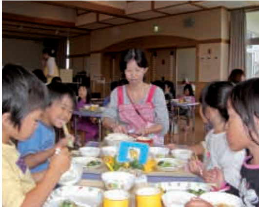
なんて元気でしょう、なんてよく食べるでしょう！ (5歳児 くま組)