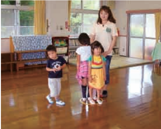
ピッ!の合図ですばやく輪の中へ…。 (3・4・5歳児 たんぼぼ・さくら・すみれ組)