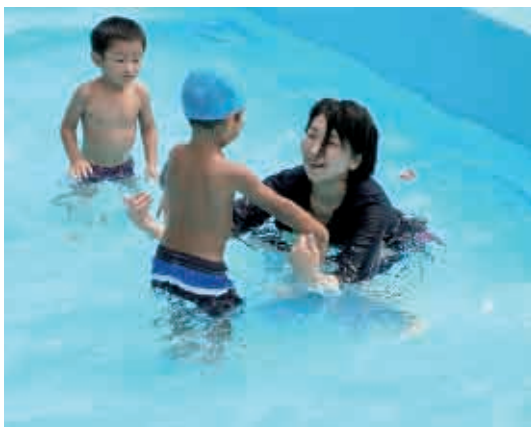
水遊びの苦手な子どもに、そっと声がけをして教えてくれます。(3歳児 うさぎ組)