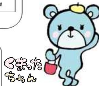
高知県立消費生活センター キャラクター