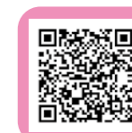
ひとり親家庭支援センター公式LINE