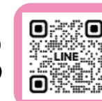
親子のための相談LINE