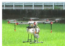
ドローンによる防除