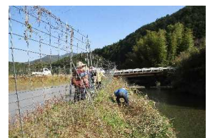
鳥獣害防護柵の整備