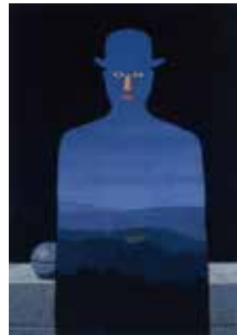
ルネ・マグリット《王様の美術館》1966年 油彩、カンヴァス 横浜美術館所蔵