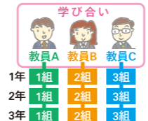
教科のタテ持ち(イメージ図)