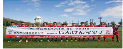
冠協賛試合（高知ユナイテッドSC vs 鈴鹿ポイントゲッターズ）