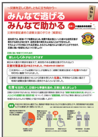
災害時要配慮者の避難支援の手引き (概要版) (平成26年3月)

災害時や災害後においても災害時要配慮者に対して人権に配慮した適切な対応が行えるよう、要配慮者対策を推進しました。