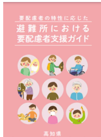
避難所における要配慮者支援ガイド (令和2年8月)