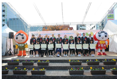
人権作文コンテスト表彰式

※ 法務局及び人権啓発センターと 県教育委員会との共催とし、広報 活動や啓発活動にも役立てている。