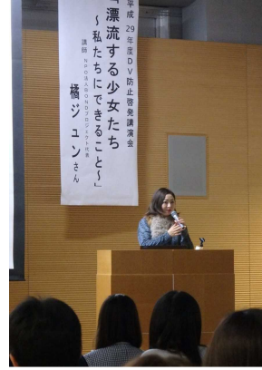
DV防止啓発講演会の様子