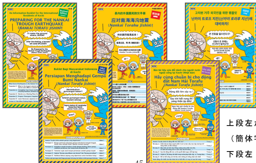
上段左から英語、中国語 (簡体字)、韓国語 下段左 インドネシア語、 ベトナム語

南海トラフ地震対策パンフレット (5 か国語)・携帯カード (6 か国語)・高知市津波ハザードマップ (3 か国語) の配布