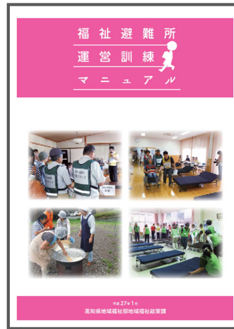
福祉避難所運営訓練マニュアル (平成 27 年 1 月)