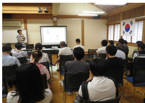
異文化理解講座（韓国）