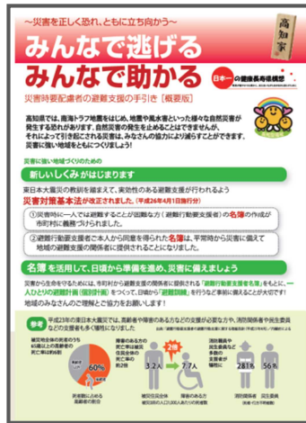
災害時要配慮者の避難支援の手引き (概要版) (平成 26 年 3 月)

災害時や災害後においても災害時要配慮者に対して人権に配慮した適切な対応が行えるよう、避難支援対策等の取組を推進しました。