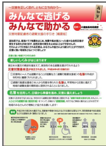
災害時要配慮者の避難支援の手引き (概要版) (平成 26 年 3 月)