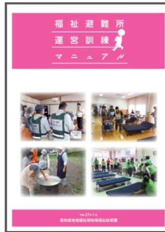
福祉避難所運営訓練マニュアル (平成 27 年 1 月)