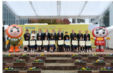
人権作文コンテスト表彰式