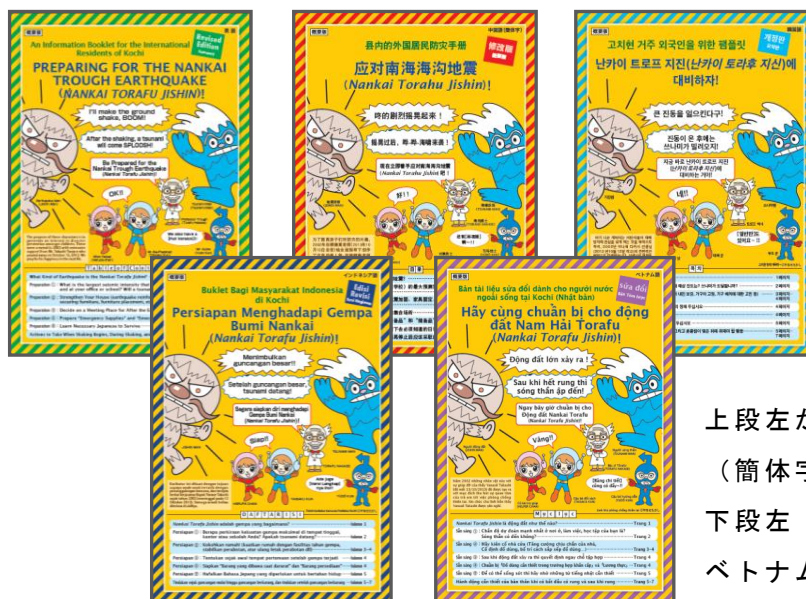
上段左から英語、中国語 (簡体字)、韓国語 下段左 インドネシア語、ベトナム語

南海トラフ地震対策パンフレット (5 か国語) ・携帯カード (6 か国語) ・高知市津波ハザードマップ (3 か国語) の配布、災害時ラジオ放送原稿の収録