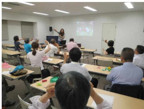
異文化理解講座（タイ）