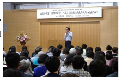
男女共同参画推進月刊講演会