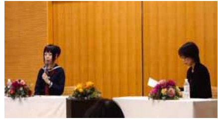
DV防止啓発講演会の様子