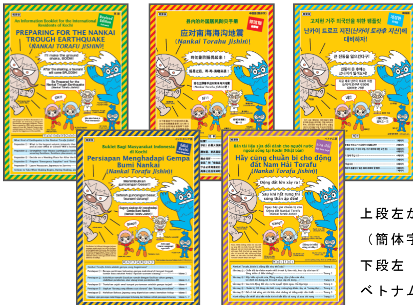
上段左から英語、中国語 (簡体字)、韓国語 下段左 インドネシア語、 ベトナム語

南海トラフ地震対策パンフレット (5 か国語) ・携帯カード (6 か国語) の配布