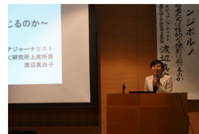
DV防止啓発講演会の様子