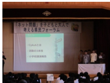
ネット問題を子どもと大人で考える 県民フォーラムの様子