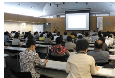
男女共同参画推進月刊講演会