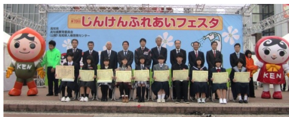
人権作文コンテスト表彰式