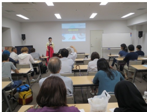
異文化理解講座（韓国）