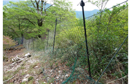
防鹿柵 (右 2018年設置)