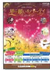
星に願いをパーティのチラシ