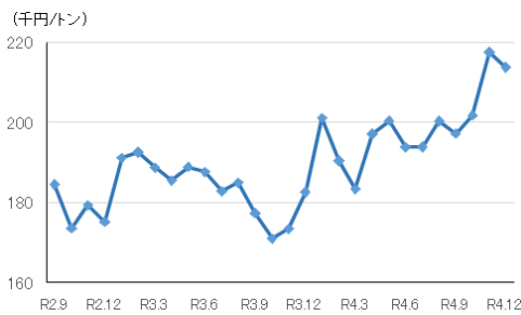
図2：配合飼料価格（円/トン）